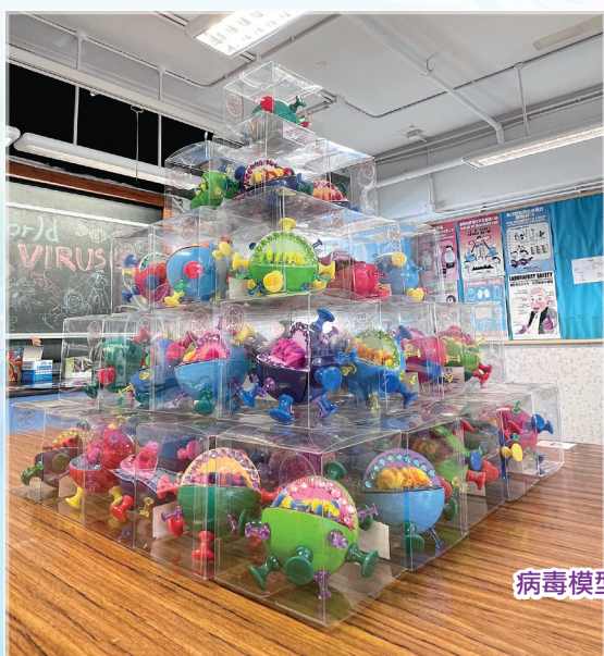
病毒模型