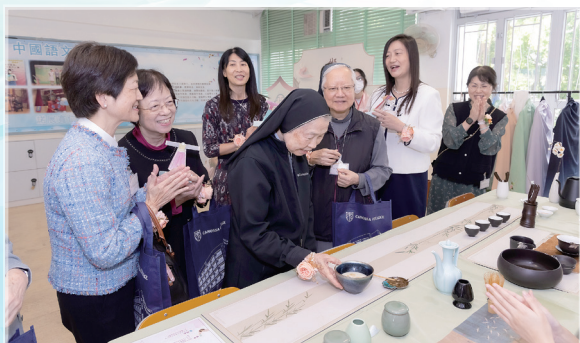
嘉賓參觀「漫遊擷芳園」