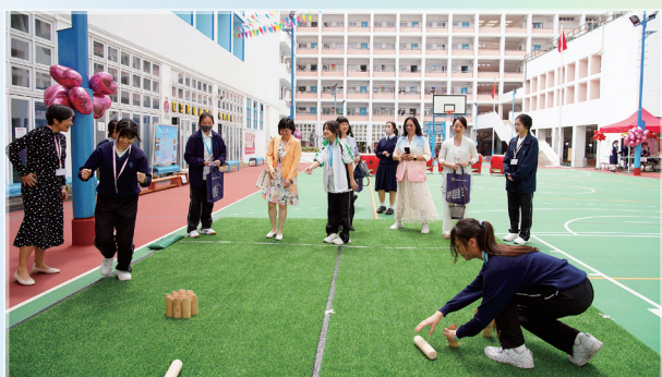
芬蘭木柱體驗設施

體育學會的成員為開放日準備了圓網球、芬蘭木柱兩種新興運動的體驗設施，同時亦有單車機、反應燈、鏡子遊戲等電子運動，讓來賓感覺耳目一新。雖然時值初春，但熾熱的太陽為開放日增添火辣辣的感覺。當值的同學揮汗如雨，但仍面帶笑容，耐心向賓客介紹運動的特色。同學們輪流當值、互相配合，儘管兩天忙過不休，但成員都樂在其中，既鼓勵了來賓多做運動，同時也提升了自己對做運動的興趣，別具意義。