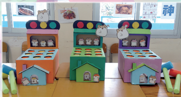
「打地鼠」遊戲

中國歷史科以道光皇帝和中國八大菜系為主題，設計了「歷史人物對對碰」、「歷史人物肖像拼圖」、「打地鼠」等遊戲，讓來賓對清代帝皇和八大菜系有更深入的了解。來賓須拼砌帝皇肖像的拼圖，然後辨認出道光皇帝的肖像。孩子們都投入參與，樂在其中。（記者：四甲鄭杏宜）