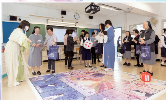
嘉賓參觀「文學環遊記」