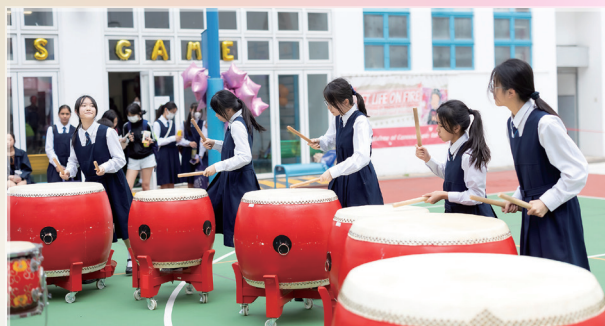
敲擊樂演出

音樂學會為開放日準備了多元化的表演，務求讓孜孜不倦地練習的同學也有一展所長的機會。表演包括合唱團的獻唱；敲擊樂、中樂團和管弦樂團的演奏，首首名曲扣人心弦、句句歌詞撼動人心。同學演出不遺餘力，觀眾報以熱烈掌聲，台上、台下氣氛熱鬧，其樂融融。（記者：三丁李綽妤）