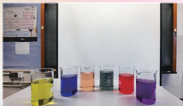
彩虹溶液實驗

從微觀到宏觀，化學揭示了世界的奧秘；從分子結構到元素周期表，化學幫助我們了解不同物質的變化。開放日期間，化學室內分成幾個區域，分別是「過三關」遊戲區、寶石展覽區，以及最為人津津樂道的實驗展示區。展示區內當值的同學將特別調製的指示劑倒進燒杯內，再加入乙醇，使每個燒杯內的溶液呈現七彩繽紛的顏色。之後同學又攪動溶液，顏色竟逐漸消失。這時同學又再在溶液內加入鹼，顏色隨即重現。最後同學將七種彩色的溶液同時倒進一個空杯內，這時原本絢爛奪目的顏色又神奇地化為一片透明。來賓目睹一系列奇幻無比的化學反應，無不嘖嘖稱奇、讚嘆不已。（記者：三甲楊凱君）